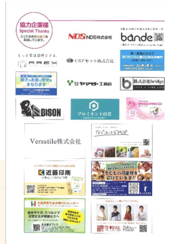
パンフレット 掲載例