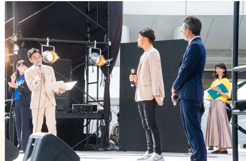
※写真は昨年の様子